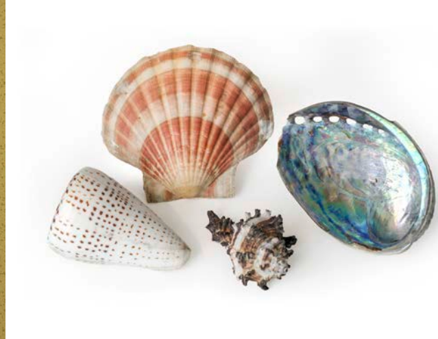
Schnecken und Muscheln aus der Konchylien-sammlung des Franz Friedrich Anton, um 1780.

In Coburg entwickelten sich naturkundliche Studien erst im 17. Jahrhundert, und meist im Umfeld des Herzogshauses mit seinen Kunst- und Naturalienkabinetten. Das erste entstand ab 1740 im akademischen Gymnasium, bis 1806 das des Herzog Franz Friedrich Anton und ab 1832 das Herzogliche Kunst- und Naturalienkabinett, aus dem sich das heutige Naturkunde-Museum entwickelte. Da es in Coburg keine Universität gab, blieben hier die naturhistorische Forschungen immer bescheiden und temporär. Trotzdem machten Universalgelehrte wie Libavius, Pernau oder Reinecke einige herausragende Entdeckungen, die in der Wissenschaftsgeschichte einen festen Platz einnehmen.