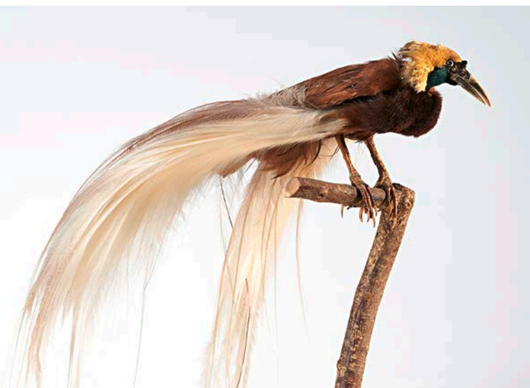
Großer Brauner Paradiesvogel aus dem Naturalien-cabinet der Prinzen Ernst und Albert, um 1835.