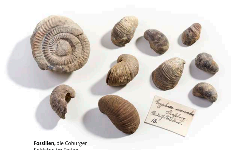
Fossilien , die Coburger Soldaten im Ersten Weltkrieg gesammelt haben.

Im Umfeld der „fürstlichen“ Sammlungen gründeten sich im Herzogtum Coburg auch bürgerliche Vereine, die bedeutende Sammlungen aufbauten. In der Ausstellung zeigen wir die des Anthropologischen Vereins (1874–1933) und Fossilien, die Coburger Soldaten im Ersten Weltkrieg gesammelt haben.