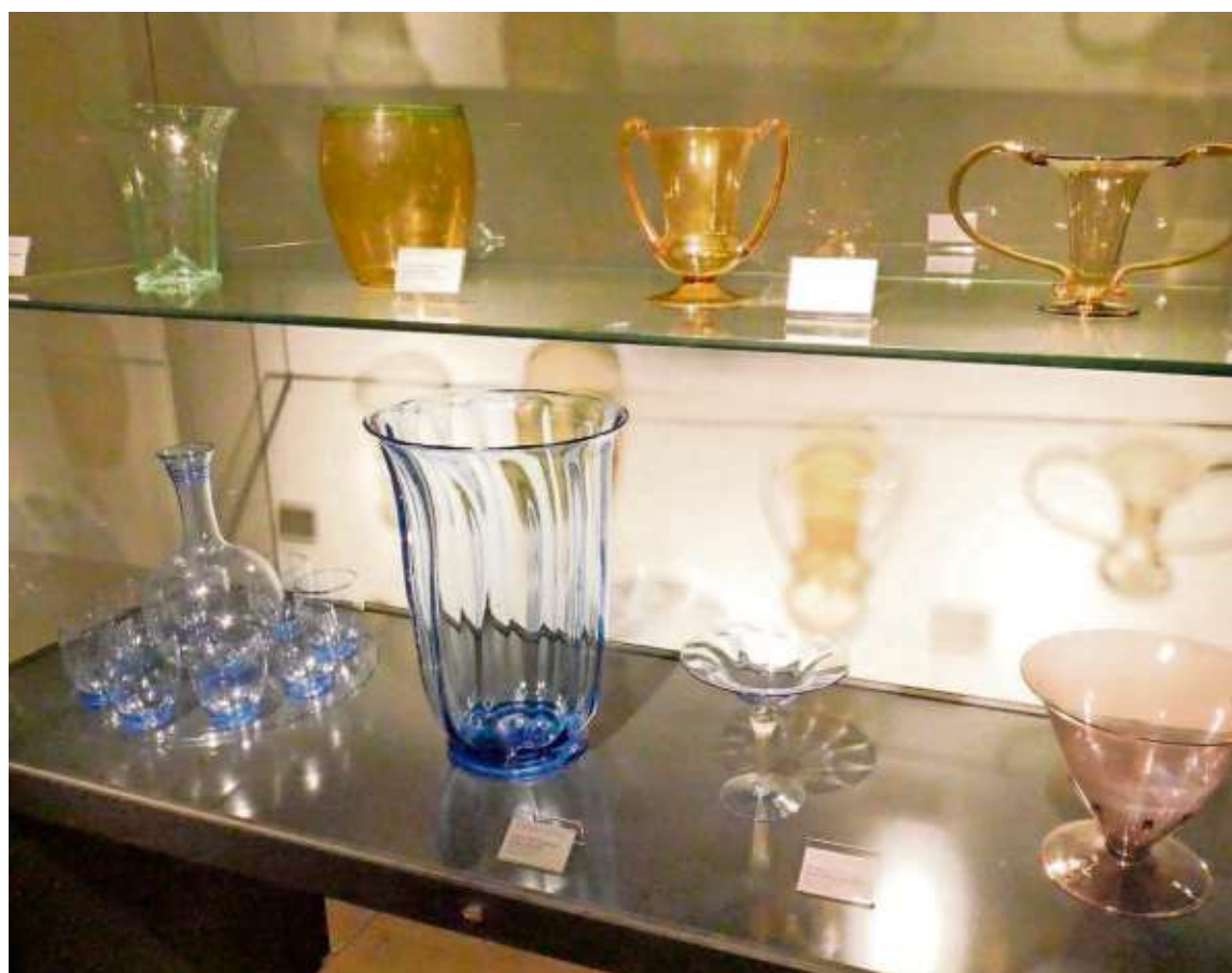
Stimmungsvoll inszeniert und illuminiert: Glasobjekte von Vittorio Zecchin werden in den Vitrinen historischen Vorbildern gegenübergestellt.

Bis 10. Januar 2021 Öffnungszeiten bis 8. November: täglich 9.30 bis 17 Uhr. Ab 10. November: Di. bis So. 13. bis 16 Uhr Führungen und Veranstaltungen werden derzeit nicht angeboten.