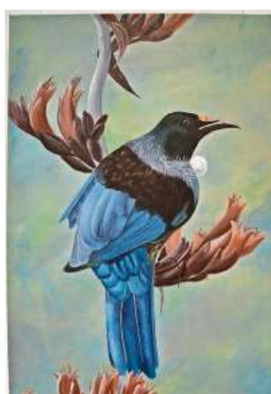
Der neuseeländische Tui.

Das Coburger Naturkundemuseum lädt dazu ein, die Schönheit Neuseelands zu entdecken. Künstlerin Steffi Rodigas hat sie festgehalten.