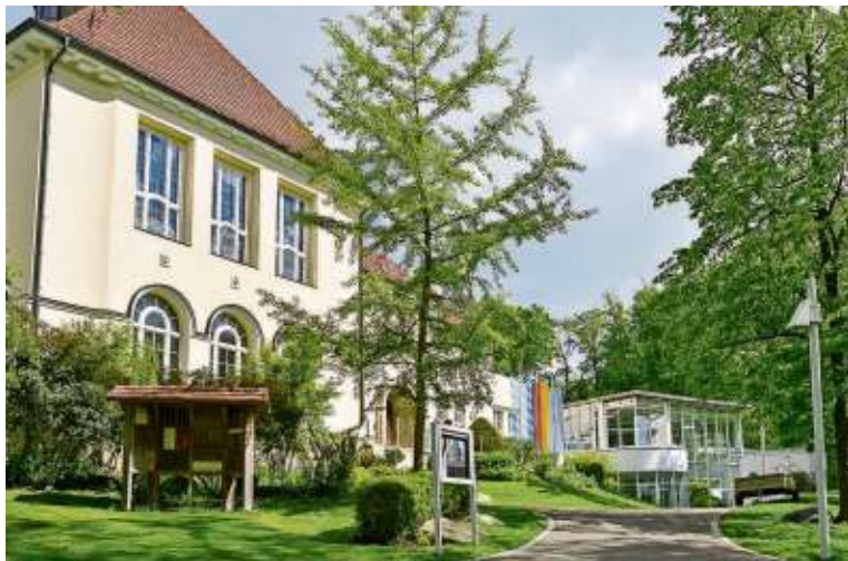
Sein heutiges Domizil konnte das Naturkunde-Museum erst 1914 beziehen. Davor war die Sammlung an mehreren Orten in Coburg untergebracht.